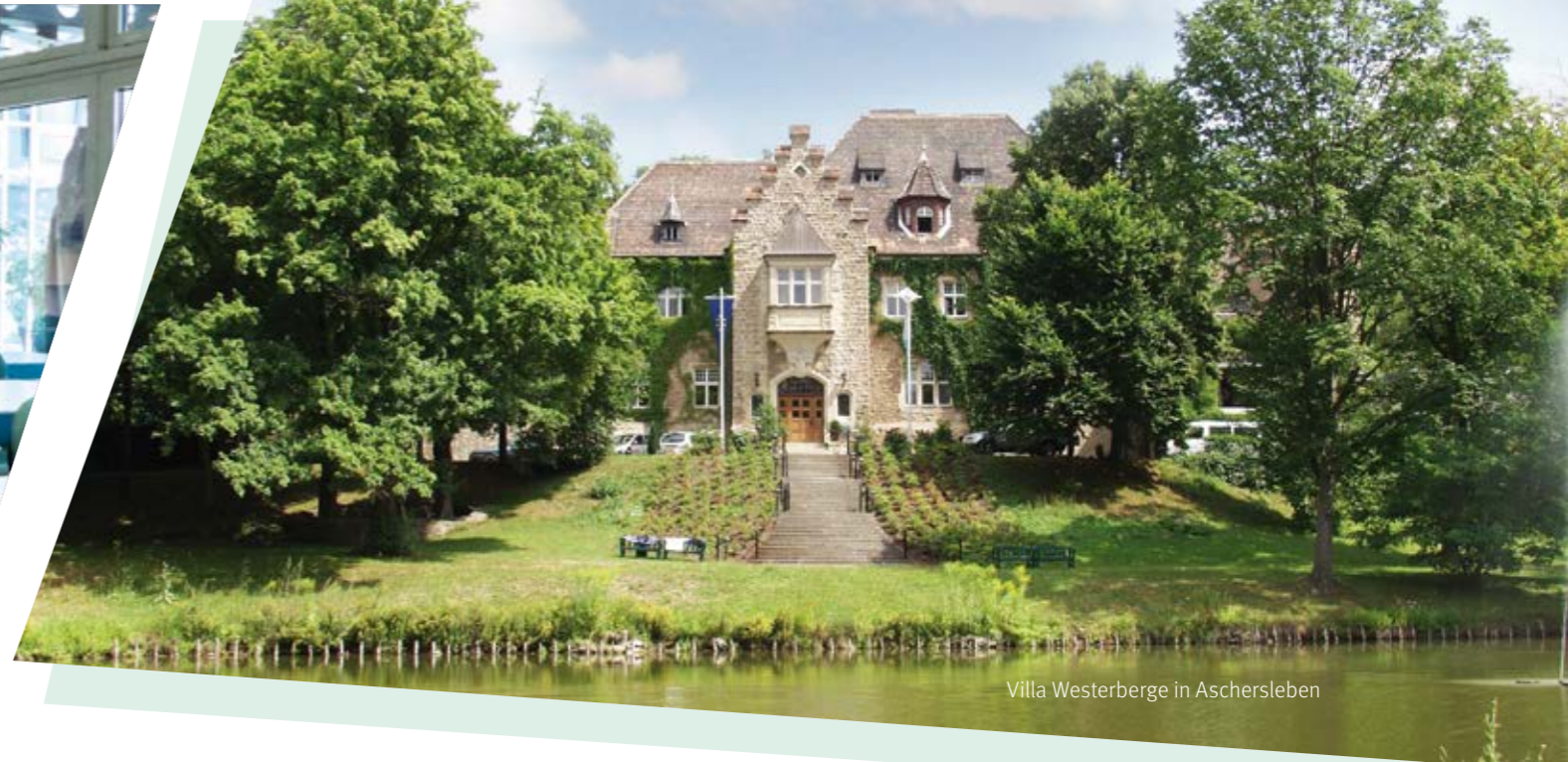
Villa Westerberge in Aschersleben

Die Berater- und Mitarbeiterqualifizierung wird bei ETL systematisch betrieben: Mit einem umfangreichen Fort- und Weiterbildungsangebot für unsere Berater und Mitarbeiter sichern wir unsere gleichbleibend hohe Beratungsqualität. Für die fortlaufende und umfassende Fortbildung in der ETL Akademie wird den Kanzleien jedes Jahr das Siegel